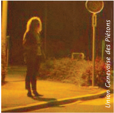
E_{sc} est nul, la lumière vient de la mauvaise direction.