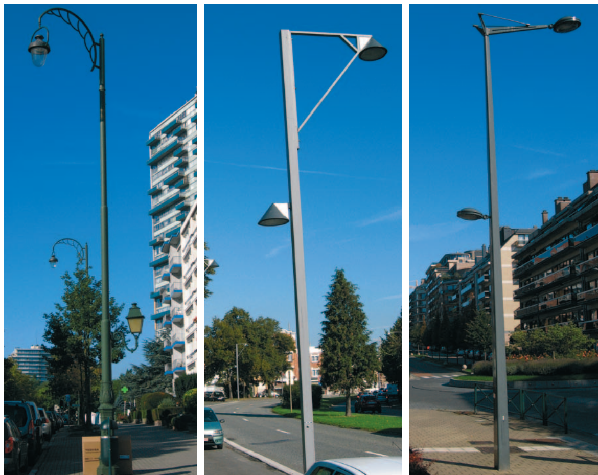
Éclairage double : un luminaire pour la chaussée et un autre pour le trottoir.

Plus le poteau est élevé ou le bras/console est placé en hauteur, plus la surface éclairée est grande mais plus l'éclairement est réduit. Si dans certains cas, la hauteur sera très basse (environ 4 à 5 mètres), elle pourra être plus élevée comme dans le cas de l'éclairage de voirie (de 6 à 9 m). Aussi, dans certains cas, une combinaison de deux éclairages spécifiques à des hauteurs différentes (par exemple l'un pour le trottoir et l'autre pour la chaussée) pourra également être réalisée sur un seul poteau (éclairage double).