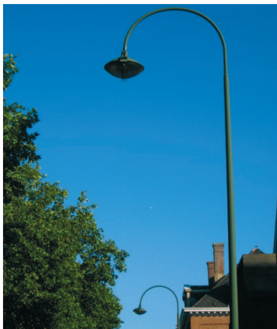
Luminaire type «Avenue du Deuxième Régiment des Lanciers».