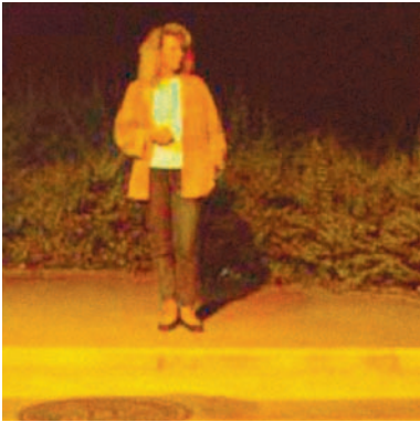
E_{sc} est optimal, le visage est facilement discernable.