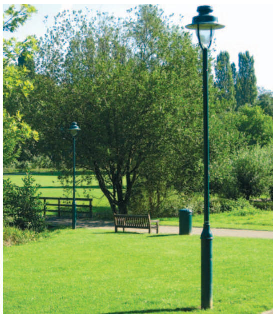
Luminaire pour chemin de promenade placé dans le parc Roi Baudouin.