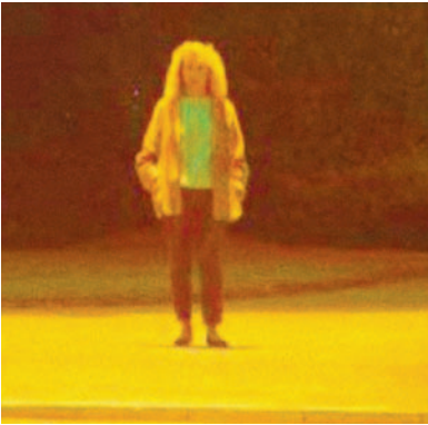
E_{sc} est faible, le visage a l'air «plat».