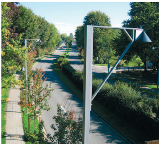
Bras et consoles type «Avenue de l'Exposition Universelle» placés sur l'Avenue du même nom.

En Région de Bruxelles-Capitale, différents types de poteaux, bras et consoles existent, chacun recevant une appellation liée à l'endroit où le modèle est placé (exemple: bras et consoles type «Avenue de l'Exposition Universelle»).