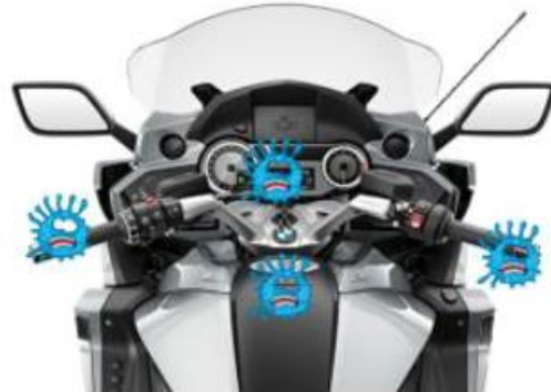
Illustration des parties à désinfecter