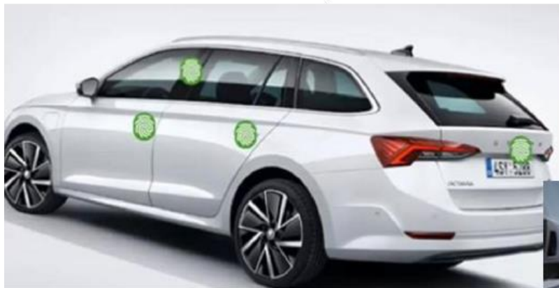
Illustration des parties à désinfecter