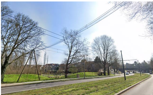
Ecologische verbinding voor eekhoorn, Expositielaan - Jette