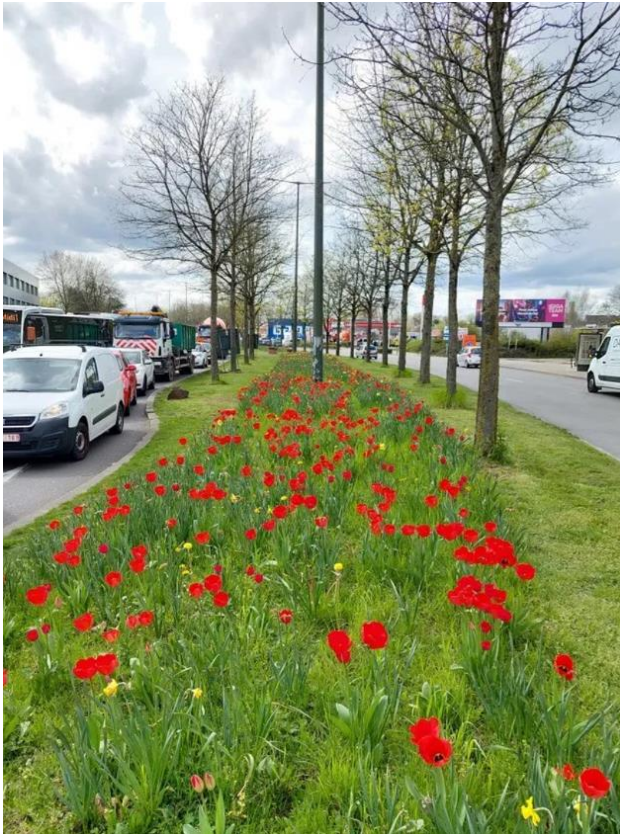
Industrielaan - Anderlecht