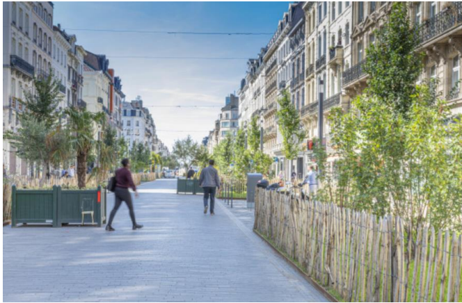
Centrale lanen – Stad Brussel