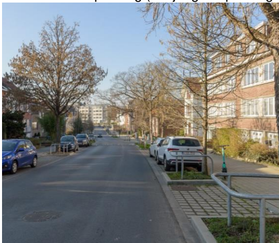
Bemptlaan - Vorst