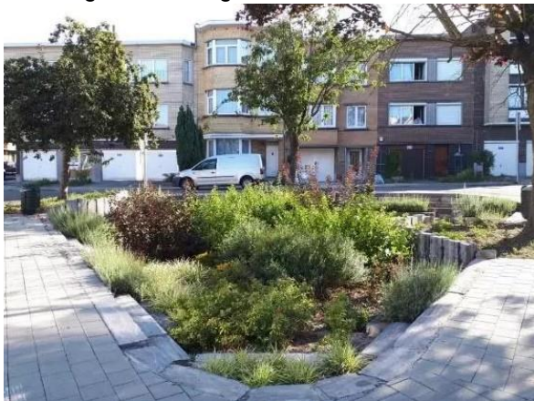
Auguste Lumièrestraat - Vorst