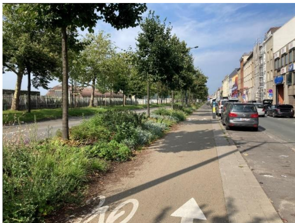
Groendreef - Brussel