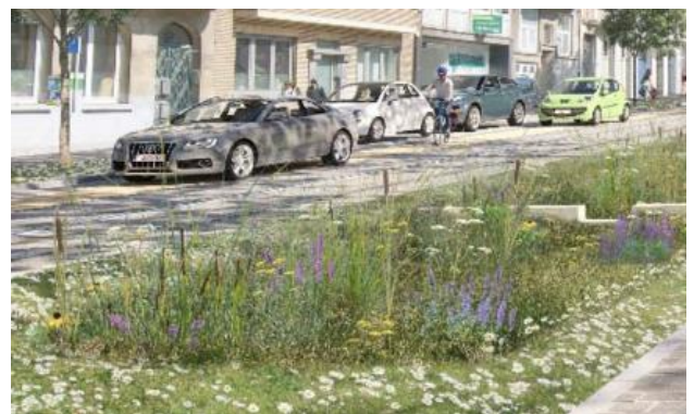
Parklaan, Vorst – Sint-Gillis