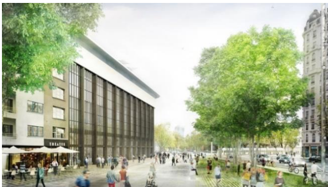
Saintelettesquare – Brussel / Sint-Jans-Molenbeek