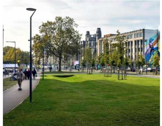
Ninoofsepoort - Sint-Jans-Molenbeek