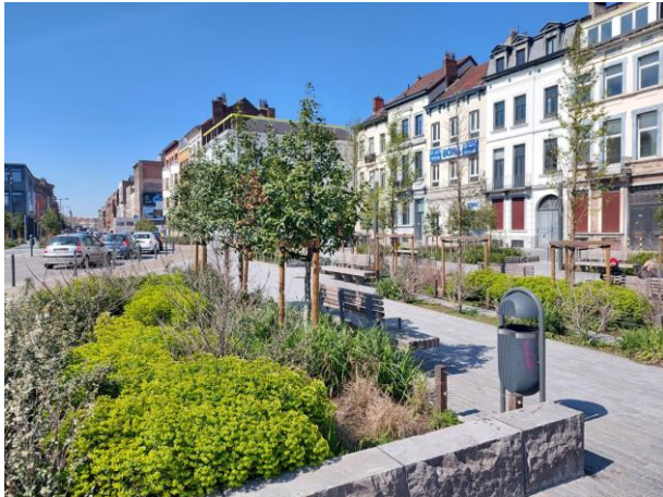
Masuiplein - Schaerbeek